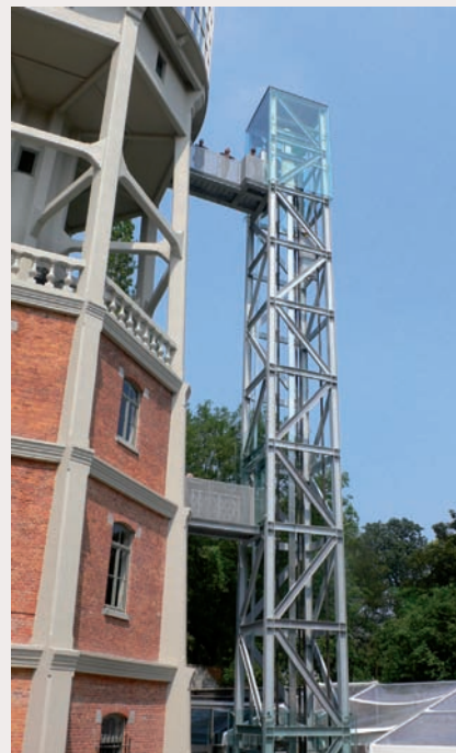
Herbestemming watertoren "Marconi" (Brussel) Arch. Paczowski et Fritsch Architectes

belang van de bouw als afzetmarkt inziert. De architecten zien in dat staal een volledig recyclebaar product is (zonder kwaliteitsverlies bij recycling) dat de creativiteit van de ontwerper stimuleert. Ook in het voordeel van staal is, dat het toelaat om snel te bouwen, waardoor op de uitvoeringsprijs kan worden bespaard. Zo kan bij hoogbouwprojecten een ganse verdieping worden opgetrokken en afgewerkt in één week. Dat gebouwen in staal zeer flexibel zijn, verhoogt de levensduur ervan, en tenslotte kunnen stalen gebouwen zonder veel problemen worden gedemonteerd, getransporteerd en gehemonteerd, waardoor een heel gebouw in staal desnoods elders kan worden heropgebouwd en opnieuw ingedeeld en aangekleed. Hierdoor heeft de (éénmalige) aankoopprijs van staal dus weinig invloed op het totale kostprijspakket van een bouwwerk.