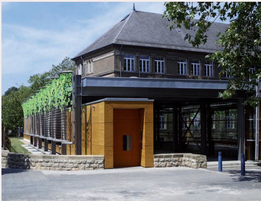
sportal van de school Dellheicht te Esch-sur-Alzette (architect Witry & Witry architecture urbanisme, Echternach). Sally Arnold - artiste (ZA)