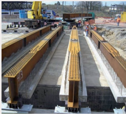
Toepassing staal/beton combinatie in meewerkende vloerplaten. Plate-forme CRM (TGV) Luxembourg.

Ir. Jo Naessens: Ten eerste: combinaties staal/beton zoals de meewerkende vloerplaten. Eurocode 4, dat eind 2006 werd gepubliceerd, biedt een groot aantal nieuwe mogelijkheden om gebouwen uitgevoerd in samenwerkende staalbetonconstructies te ontwerpen en te berekenen. Staalplaat-betonvloeren bestaan uit een koudvervormde geprofileerde staalplaat